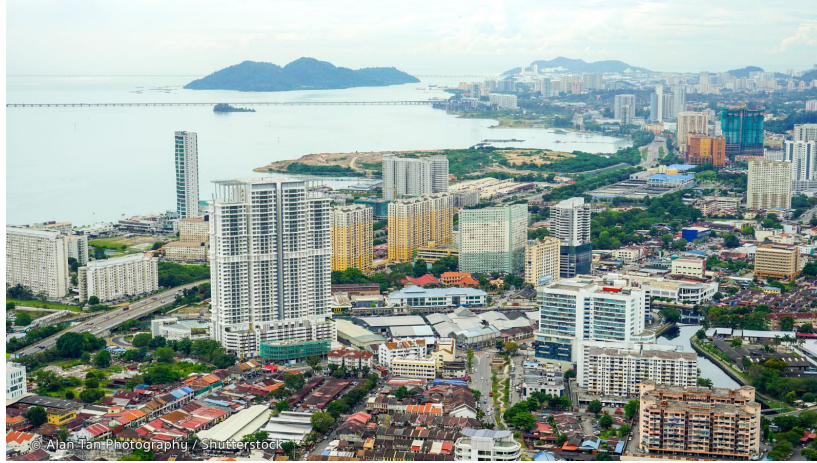
Gambar 1: Kawasan Bayan Lepas

juga turut berbeza. Pulau Pinang juga telah berjaya mengekalkan penglibatan syarikat multinasional lebih daripada tiga dekad.