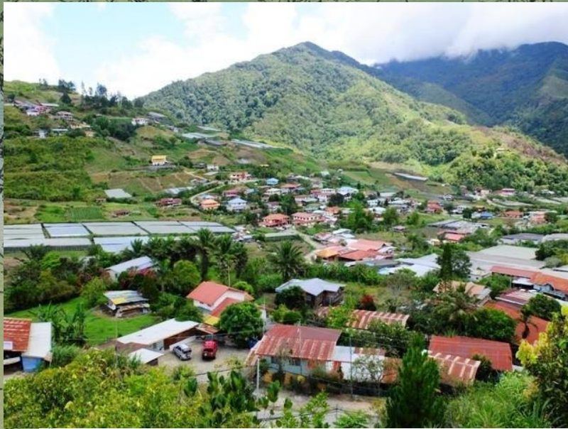
KAWASAN PETEMPATAN PENDUDUK (Secara berkelompok)