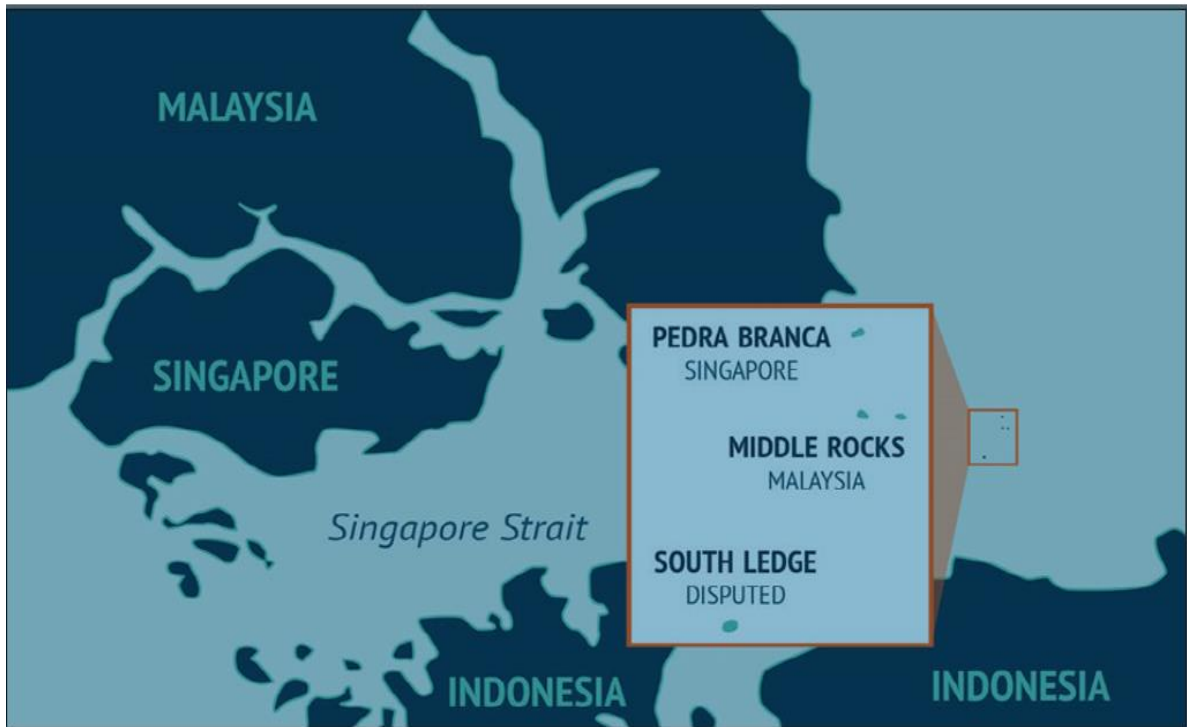
Peta 1 : Wilayah Pedra Branca