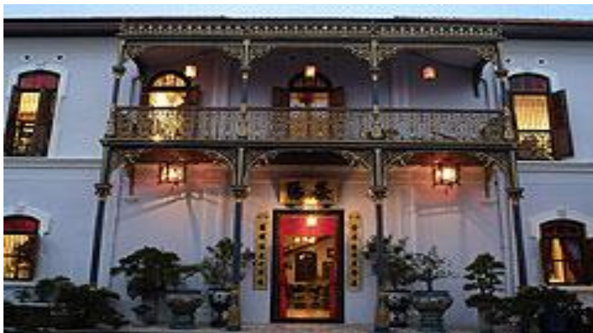
Rumah Baba Nyonya di Pulau Pinang

Selain itu, bagi seni bina masyarakat Cina pula terdiri daripada dua jenis iaitu tradisional dan Baba Nyonya. Contoh seni bina tradisional iaitu kuil yang merupakan tempat sembahyang bagi masyarakat Cina. Kebanyakan rumah lama terutamanya di Melaka dan Pulau Pinang adalah daripada warisan Baba Nyonya yang boleh dilihat daripada seni bina rumahnya iaitu dibina dengan halaman dalam rumah serta dihiasi jubin cantik dan warna warni.