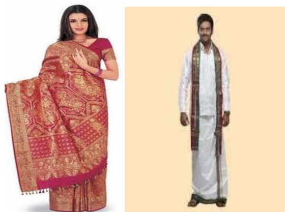
‘Sari atau Dhoti’, Pakaian Tradisional India