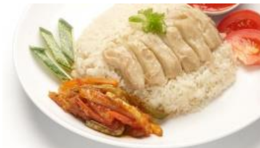
Nasi Ayam Hainan