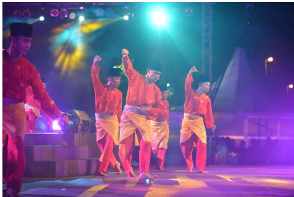
Tarian Zapin (Johor Bahru)