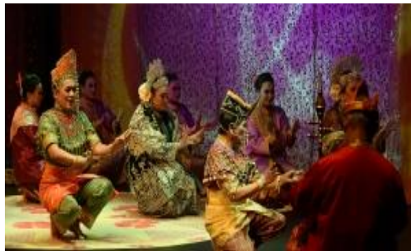
Tarian Makyong (Kelantan)

Dari segi tarian pula, Malaysia terkenal dengan pelbagai jenis tarian yang menarik. Hal ini kerana masyarakat Malaysia yang terdiri daripada pelbagai budaya, agama dan etnik yang berbeza. Bagi masyarakat Melayu, tarian selalunya berbeza mengikut negeri masing-masing seperti tarian Zapin (Johor Bahru), Boria (Pulau Pinang), Tarian Makyong (Kelantan), tarian Kuda Kepang (Johor), tarian Sumazau (Kadazan Dusun) dan sebagainya. Tarian ini mempunyai maksudnya yang tersendiri serta budaya negeri tersebut. Bagi masyarakat Cina pula, tarian 'Singa' merupakan salah satu tarian yang sangat terkenal di Malaysia khususnya ketika perayaan Tahun Baru Cina. Tarian ini melambangkan budaya dan pegangan agama masyarakat Cina sendiri. Manakala bagi kaum India pula mereka mempunyai tarian tradisional yang tersendiri iaitu dikenali sebagai 'Shahtriya Devesh'. Istilah ini bermaksud payung untuk pelbagai seni persembahan yang berakar dalam gaya teater musical Hindu dengan dipraktikkan dengan teks Sanskrit Natya Shastra. Sabah dan Sarawak juga mempunyai pelbagai jenis tarian mengikut etnik masing-masing. Tarian yang selalu didengar dan popular di Sabah adalah tarian 'sumazau' di mana merupakan perayaan Tadau Keamatan yang diraikan oleh masyarakat Kadazan di Sabah pada bulan Mei setiap tahun setelah selesai musim menuai padi.