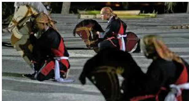
Tarian Kuda Kepang (Johor Bahru)