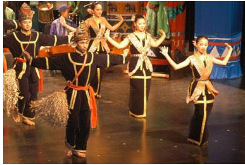
Tarian Sumazau (Kadazan Dusun, Sabah)