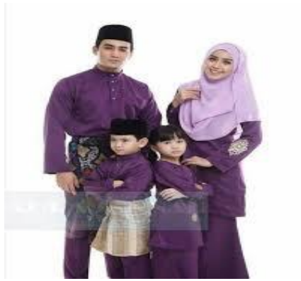
Baju Melayu dan Baju Kurung, Pakaian Tradisional Melayu