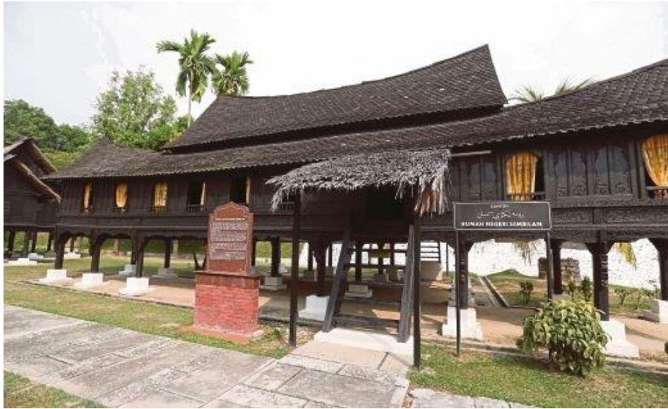
Rumah Tradisional Negeri Sembilan