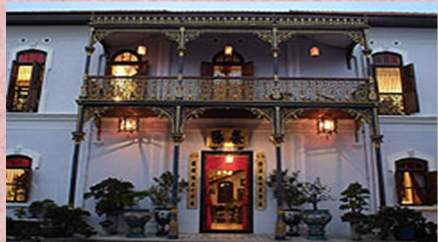
Rumah tradisional masyarakat Cina di Melaka