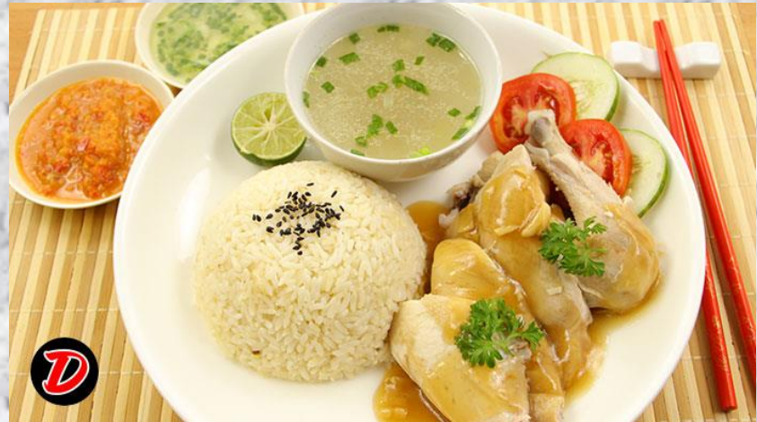
NASI AYAM HAINAN