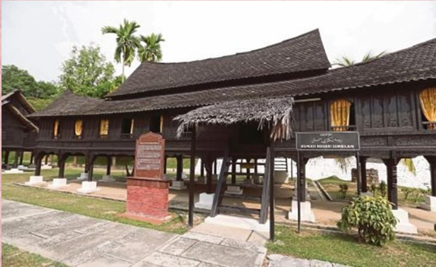
Rumah tradisional Negeri Sembilan