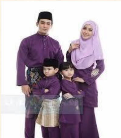
Baju Kurung dan Baju Melayu (Kaum Melayu)