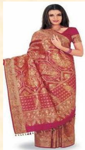
Sari dan Dhoti (Kaum India)