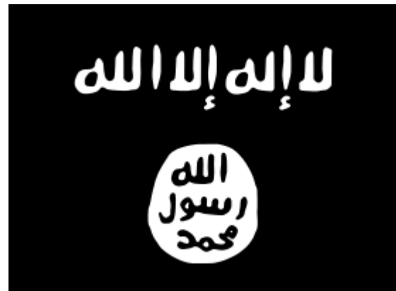
Bendera Abu Sayyaf