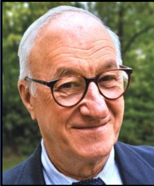
TEORI ALBERT BANDURA