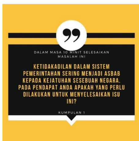
Contoh petikan kumpulan 1

Aktiviti kedua ini merupakan tugas secara berkumpulan. Dalam aktiviti ini pensyarah memberikan autonomi kepada para pelajar untuk membentuk kumpulan. Setiap kumpulan mestilah terdiri daripada 3 orang ahli sahaja. Setelah kumpulan dibentuk pensyarah akan meminta wakil kumpulan untuk memilih warna yang terdapat di skrin komputer masing-masing. Kesemua warna tersebut mengandungi satu petikan yang berbeza. Petikan yang diberikan adalah berbeza bagi setiap kumpulan.