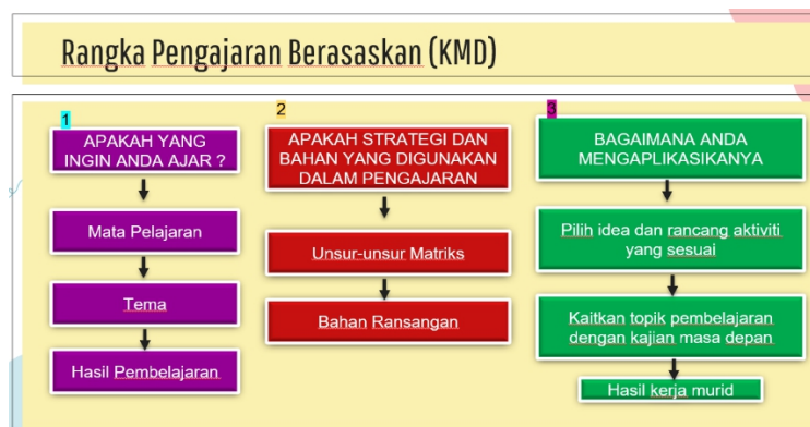
Contoh Rangka Pengajaran Berasaskan KMD

Aktiviti yang ketiga merupakan aktiviti secara berkumpulan. Aktiviti ini merupakan aktiviti jangka masa panjang. Tugas ini merupakan tugas yang mempunyai markah sebanyak 40%. Melalui aktiviti ini pensyarah akan membahagikan pelajar kepada 4 kumpulan yang ahlinya terdiri daripada 5 orang. Setiap kumpulan akan diberikan tajuk secara undian online menggunakan Wheels of name oleh pensyarah. Seterusnya setiap kumpulan akan diberikan satu contoh rangka perancangan pengajaran dan pembelajaran berpandukan konsep KMD. Berdasarkan tajuk yang telah diperolehi pelajar dikehendaki membuat rangka pengajaran dan pembelajaran berasaskan KMD seperti yang diberikan oleh pensyarah.