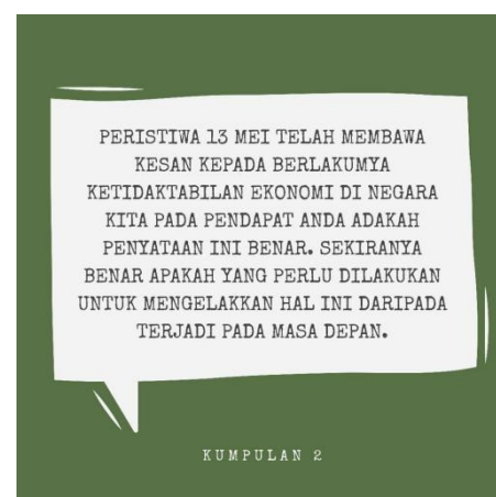
Contoh petikan kumpulan 2

Setiap kumpulan dikehendaki untuk menyelesaikan masalah yang terdapat dalam petikan tersebut menggunakan komponen khusus yang terdapat dalam KMD. Pelajar diberikan masa selama 10 minit untuk menyenaraikan isi-isi penting. Setelah siap menyenaraikan isi-isi