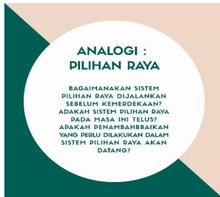
Contoh Analogi yang diberikan.

Aktiviti pertama ini merupakan aktiviti secara individu yang akan dilakukan oleh pelajaran di mana aktiviti ini mengkehendaki pelajar diberi masa selama 5 minit untuk meneliti analogi yang diberikan.