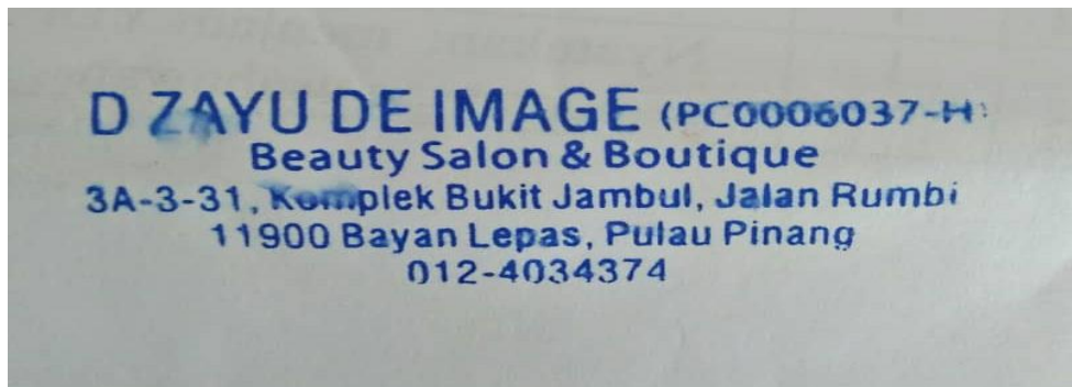
Gambar 2 diatas menunjukkan kad perniagaan usahawan