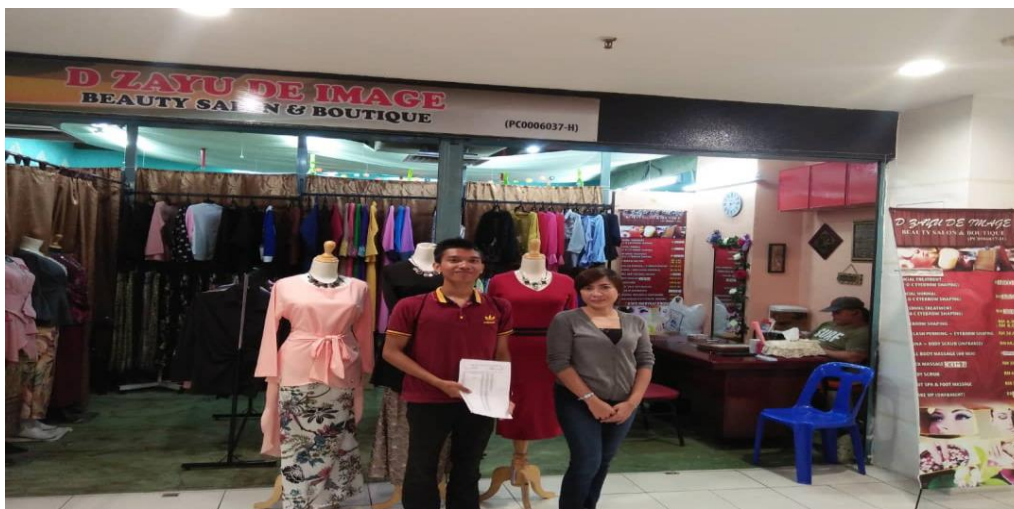
Gambar 3 menunjukkan pengkaji bersama-sama usahawan dihadapan premis beliau