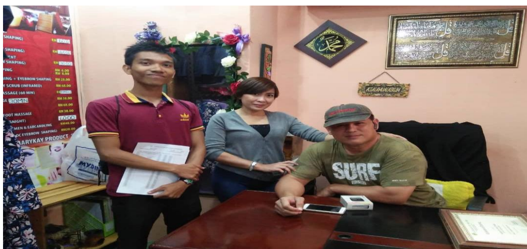
Gambar 4 menunjukkan pengkaji bergambar bersama-sama usahawan dan suaminya