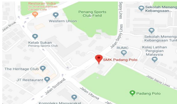
Peta 3: SMK Padang Polo

(Sumber: https://www.google.com.my/maps/ )