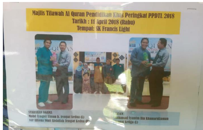
Foto 4: Majlis Tilawah Al-Quran Pendidikan Khas Peringkat PPDTL 2018