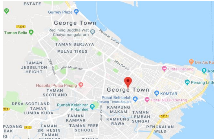
Peta 2: Geogetown