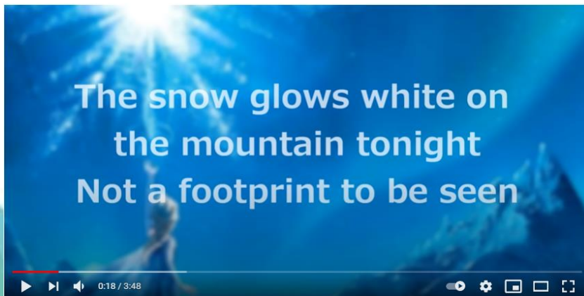
Lyrics: "Let it Go" (Full Song by Idina Menzel)